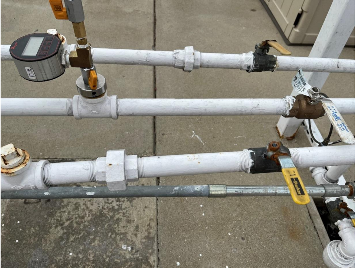
Figura 9-30: Prueba de fugas para GREEN MACHINE