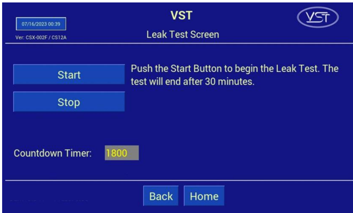
Figura 9-28: Pantalla de la pruebas