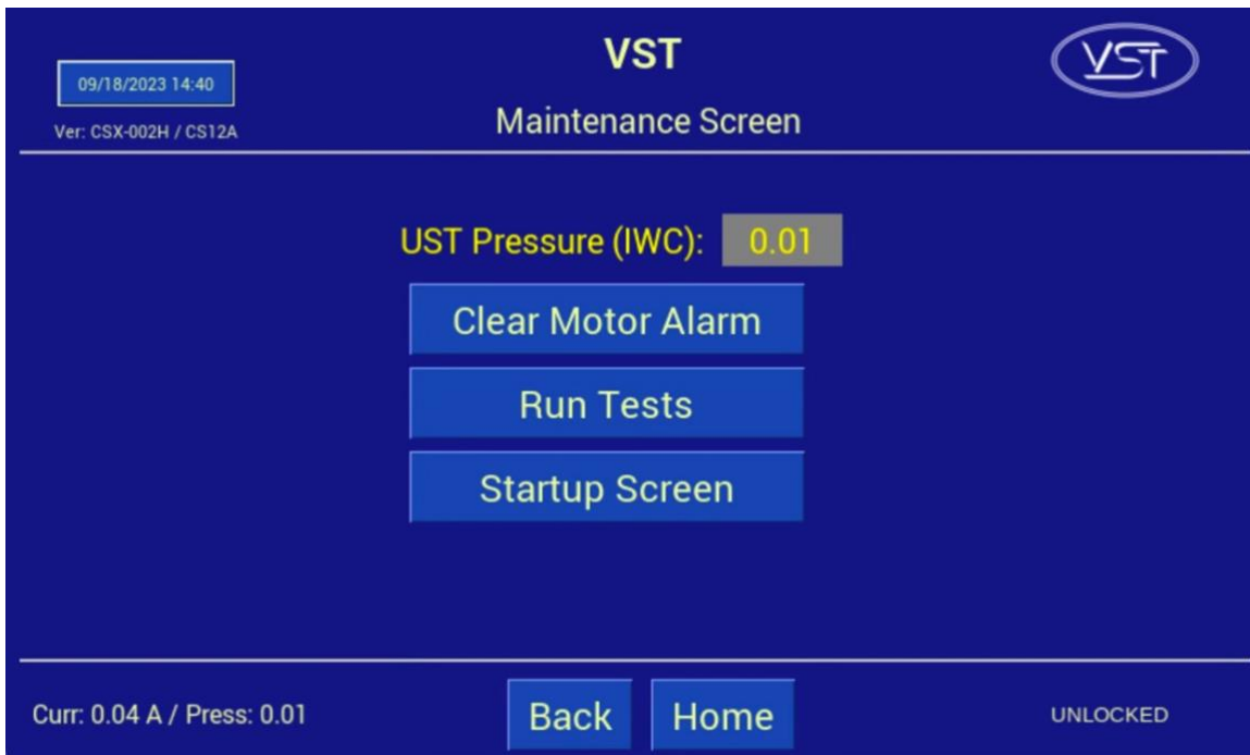
Figura 9-27: Pantalla de mantenimiento