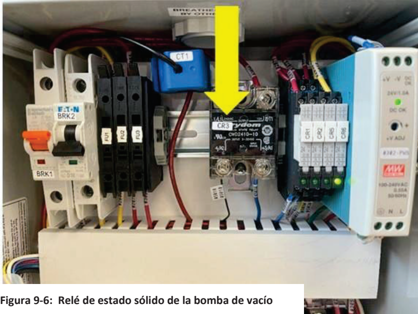
Figura 9-6: Relé de estado sólido de la bomba de vacío

(NOTA: Es posible que el componente del panel de control no esté en la posición que se muestra según la revisión del panel de control. Consulte siempre los números de cable y componente).