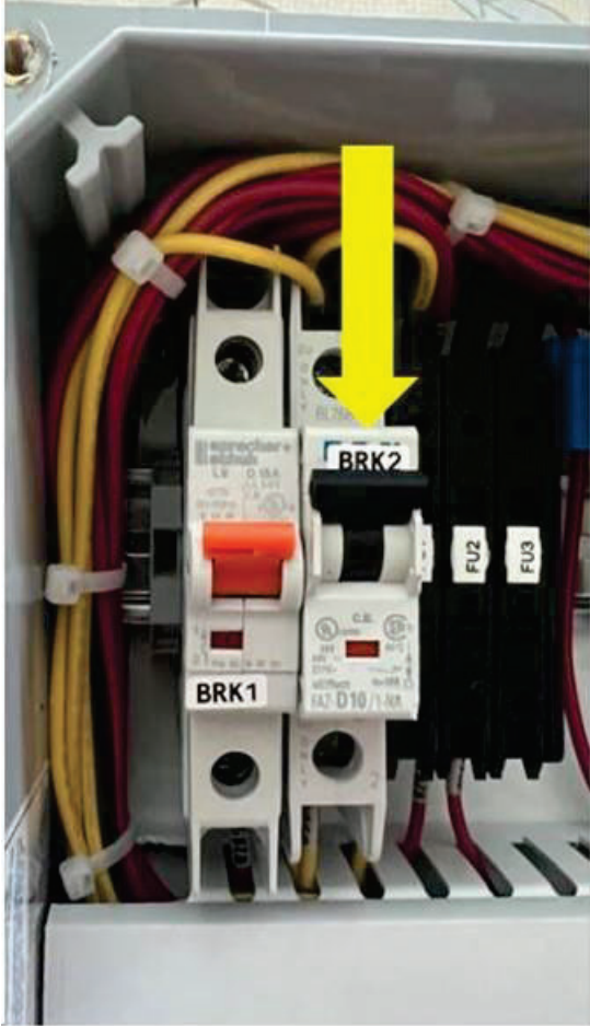
Figura 9-4: Disyuntor de apagado de derivación del dispensador (BRK2) en la posición ARRIBA (CERRADO) durante el mantenimiento.