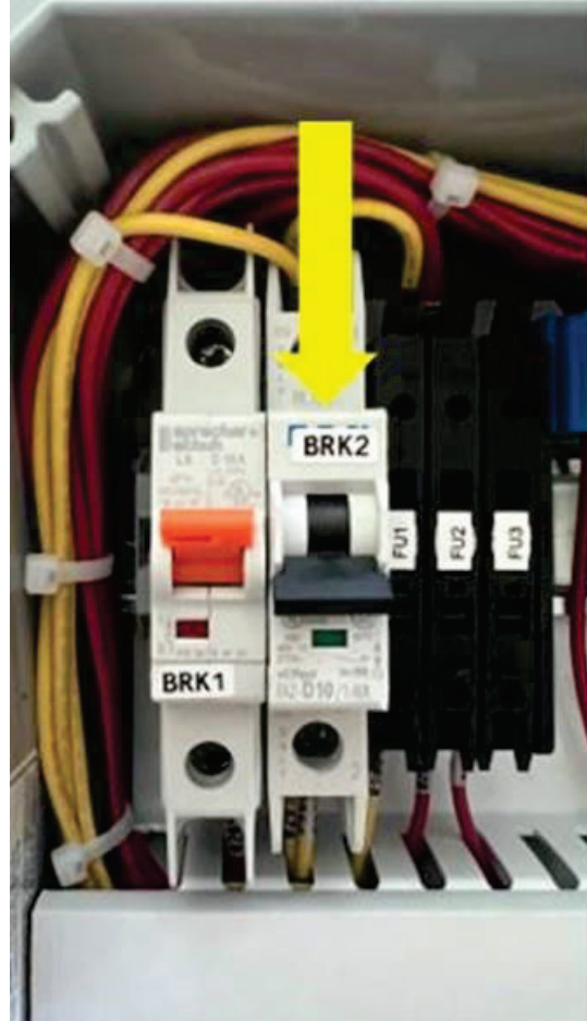
Figura 9-5: Disyuntor de apagado de derivación del dispensador (BRK2) en la posición ABAJO (ABIERTO) durante el mantenimiento.

(NOTA: Es posible que el componente del panel de control no esté en la posición que se muestra según la revisión del panel de control. Consulte siempre los números de cable y componente).