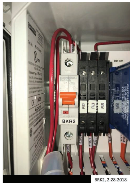
Figura 9-8: Bomba de vacío BRK2