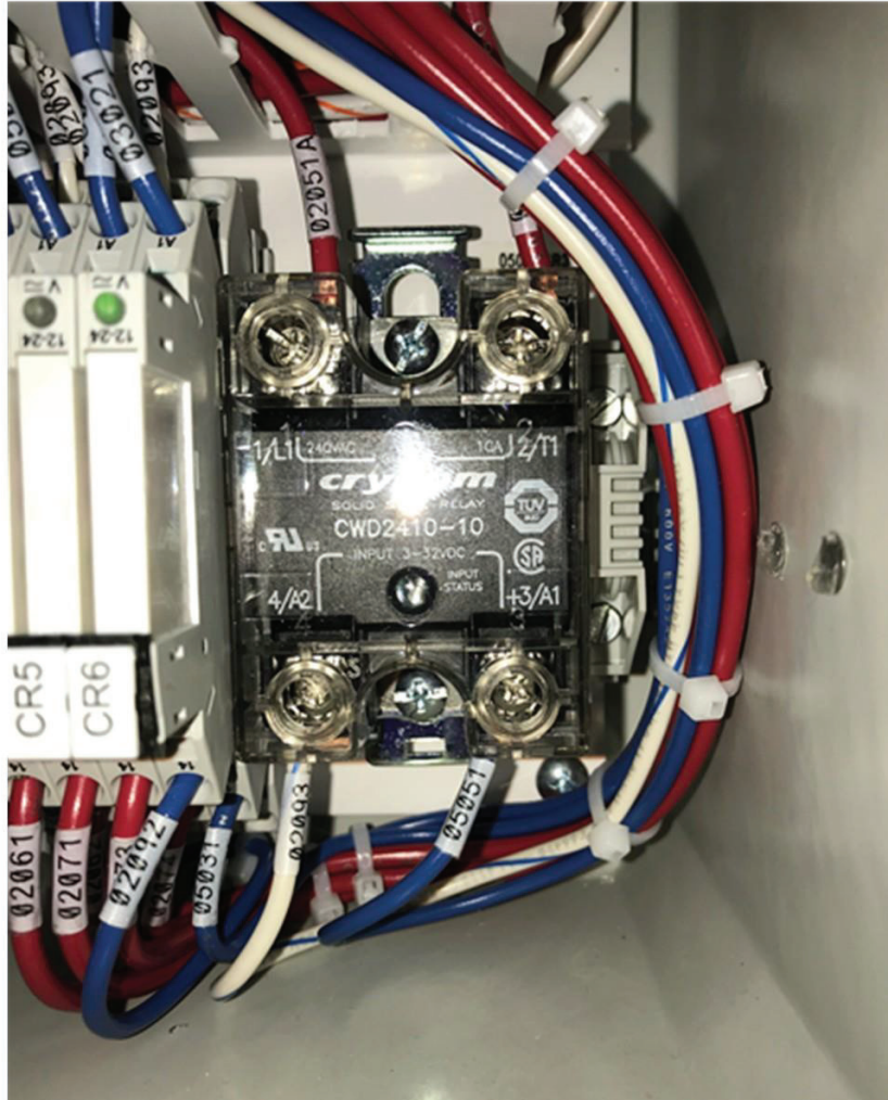
Figura 9-9: Relé de estado sólido de la bomba de vacío