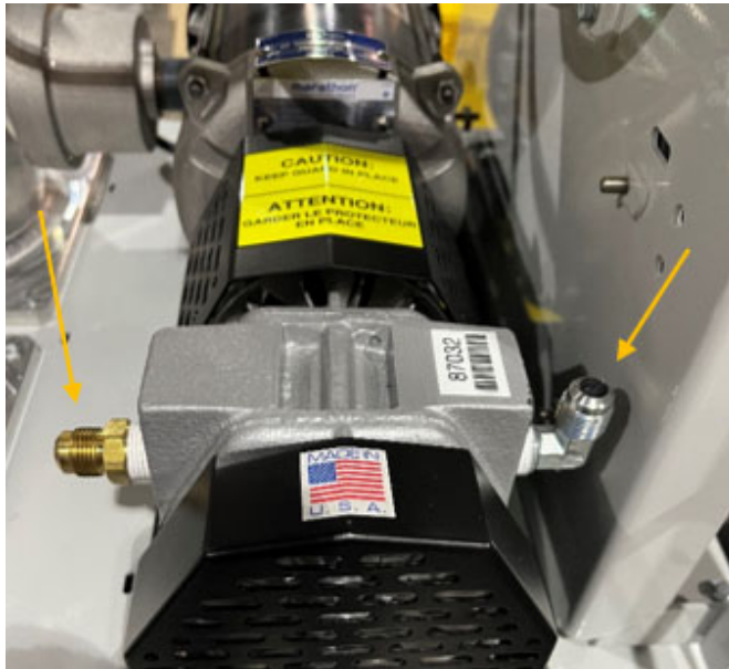
Figure 9-9: Retire los dos tubos en la bomba