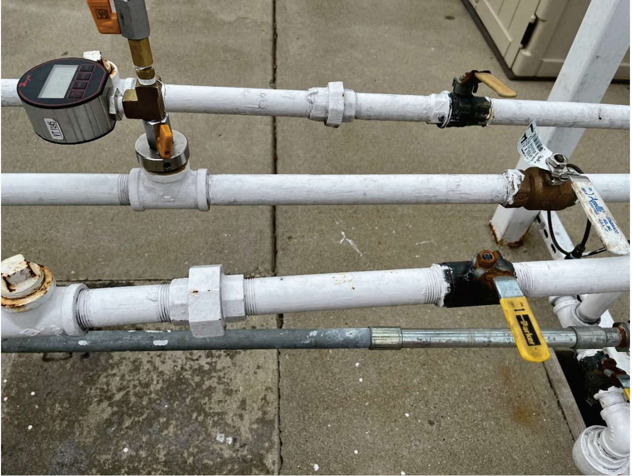
Figura 9-29: Prueba de fugas para GREEN MACHINE