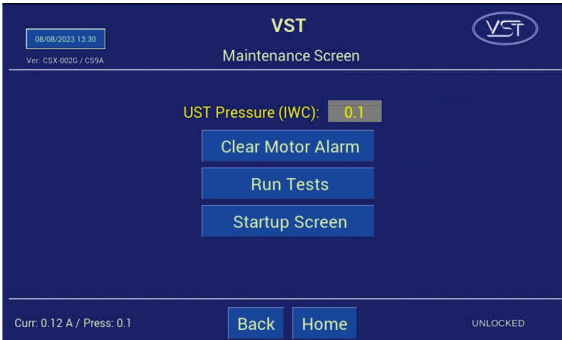
Figura 9-26: Pantalla de mantenimiento