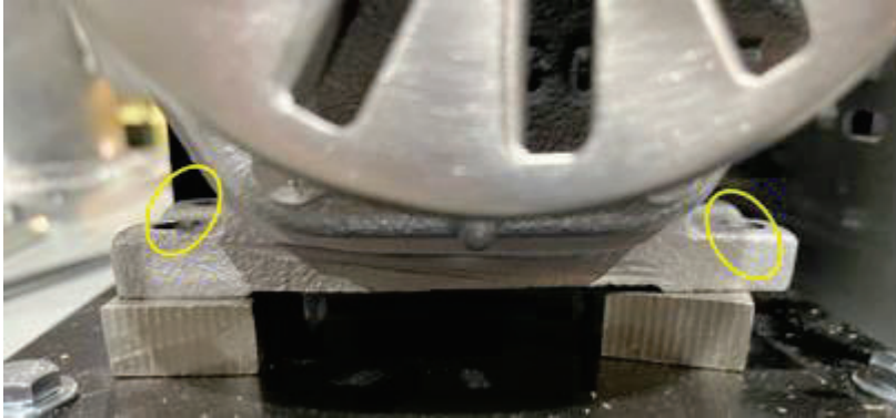
Figura 9-9: Retire los 4 pernos de montaje del motor de la placa base del motor