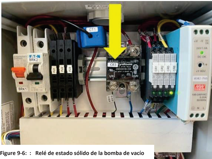
Figure 9-6: : Relé de estado sólido de la bomba de vacío